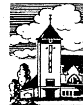
H. Hart van Jezus